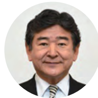
小椋 正清 東近江市市長

1951年東近江市蛭谷町(小椋谷)出身。2012年滋賀県を退職後、2013年2月から東近江市市長(現在2期目)。森林資源を見直し、木地師文化の継承と森林文化の大切さを伝えている。